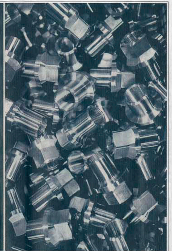
Viktiga detaljer. Mindre svarvade artiklar mellan 5 och 65 millimeter i diameter är det som erbjuds. Framgångskonceptet är att ha många kunder som beställer mindre partier.